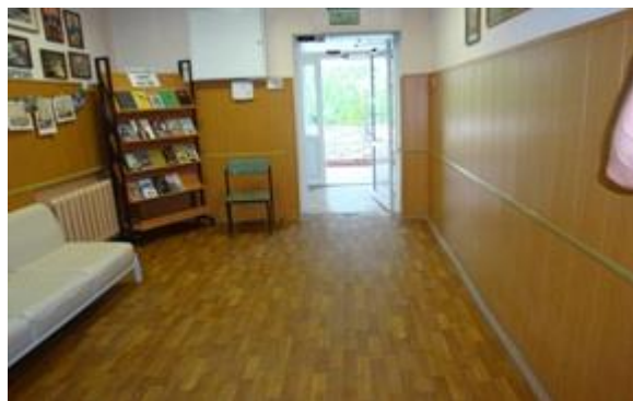
ГУ «Республиканская специальная библиотека для слепых»

В ГУ «Республиканская специальная библиотека для слепых», МБОУ «Средняя общеобразовательная татарско-русская школа №80» не выполнены работы, предусмотренные ГОСТ Р 52875-2007 по устройству напольных тактильных полос в коридоре здания.