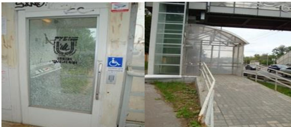
ул. Глушко. Один лифт не работает. В кабине лифта разбиты стекла.