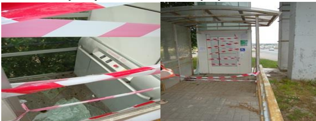
ул. Оренбургский тракт (РКБ). Один лифт не работает, разбиты стекла.